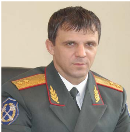
И.Г. Степаненко, начальник Управления ФСКН России по Приморскому краю, генерал-лейтенант полиции